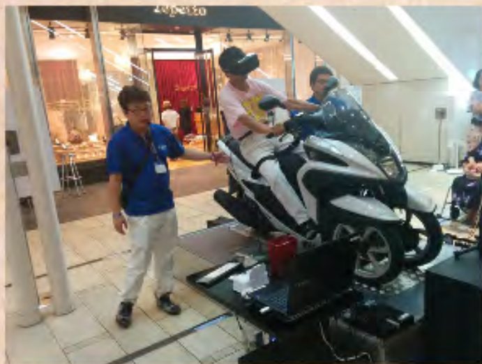
Vertical Tricity Ride