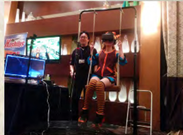
Urban Coaster HARDMODE