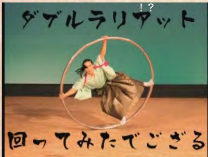
ダブルラリアット 回ってみただござる