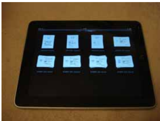
図 2 . iPad 上での多言語対応 SOS カード