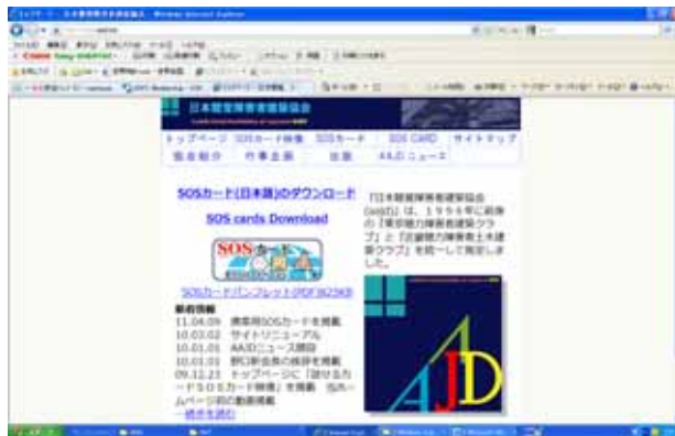
図 3 . SOS カードのホームページ